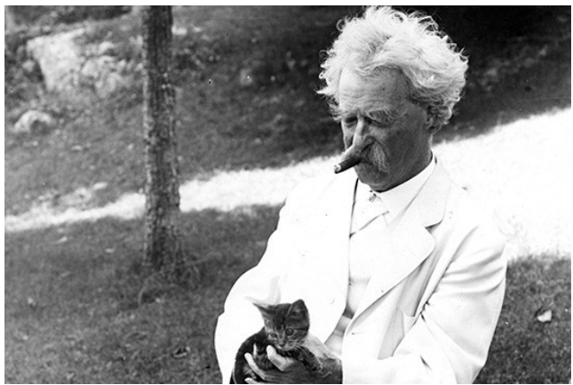
มาร์ก ทเวน (Mark Twain)

“สองวันที่สำคัญที่สุดในชีวิต คือ วันที่คุณ...เกิดมา กับ วันที่คุณรู้ว่า...เกิดมามีทำไม”